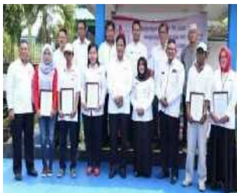
Gambar 2. Foto bersama Pengurus PMI Provinsi Kepri, Pengurus PMI Kota Tanjungpinang, Wakil Walikota Tanjungpinang dan para relawan Tahun 2018