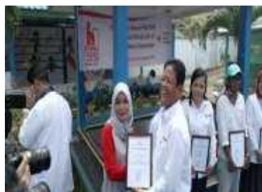
Gambar 3. Pemberian piagam penghargaan dari Palang Merah Indonesia

Provinsi Kepulauan Riau kepada Komunitas Pendonor darah KEPRI Dengan minimnya anggaran Palang Merah Indonesia Kota Tanjungpinang tetap berjalan melaksanakan tugas dengan semestinya, tetap memberikan pelayanan donor darah sesuai standart yang telah ditentukan. Tentu Palang Merah Indonesia Kota Tanjungpinang tetap memberikan teguran atau tindakan tegas bagi pegawai yang melanggar aturan serta kode etik dari Palang Merah Indonesia itu sendiri. Hal tersebut dilakukan supaya mencapai tujuan serta kepuasan secara maksimal.